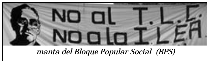
manta del Bloque Popular Social (BPS)

❖ La determinación por lograr la ratificación del CAFTA tanto por la Administración Bush como por los grupos élites de Centro América hizo que éstos tomaran medidas represivas hacia grupos del movimiento social que se oponían a éste. En El Salvador, la policía fue violenta con los manifestantes que protestaban unos días antes de que la Asamblea Legislativa votara a favor en el 2004. El CAFTA fue ratificado únicamente bajo una fuerte presencia de la policía anti-motines que rodeó la Asamblea Legislativa. En abril de 2005 dos manifestantes fueron asesinados en Guatemala durante una protesta en contra del CAFTA y en Honduras el gobierno también hizo uso de policías anti-motines para prevenir el avance de miles de manifestantes.